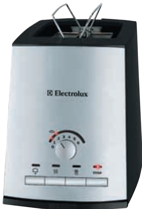
Тостер EAT 6000

Поэтому в ближайшее время под маркой Electrolux в продаже появятся кофеварки, кофемашины, электрические чайники, тостеры, настольные грили.