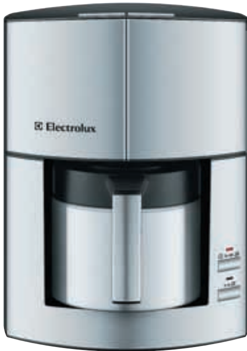
Кофеварка EKF 6000

Сегодня завтрак в России не намного отличается от европейского. Рисовая или овсяная каша с вареньем, оладьи со сметаной, омлет