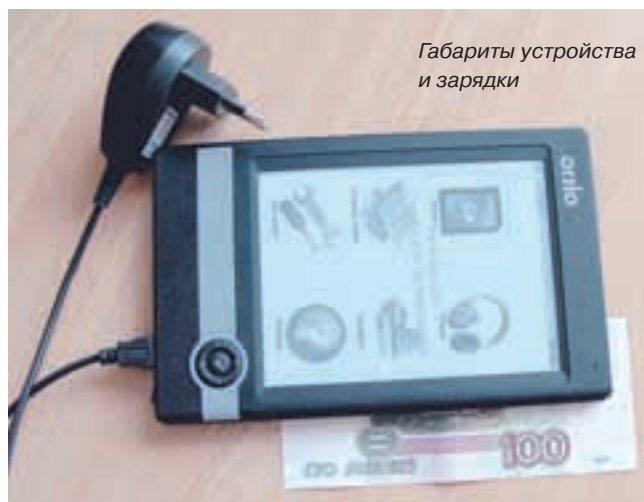
Габариты устройства и зарядки

Теперь о главном — об экране. Он действительно хорош. Создается ощущение, что под тончайшей небликующей пленкой находится обычная бумага. Причем не абсолютно гладкая, а чуть шероховатая, с настоящими целлюлозными микроволокнами. Цвет экрана, в противовес TFT-матрицам, не раздражает бело-синеватым свечением. Он имеет спокойный мо-