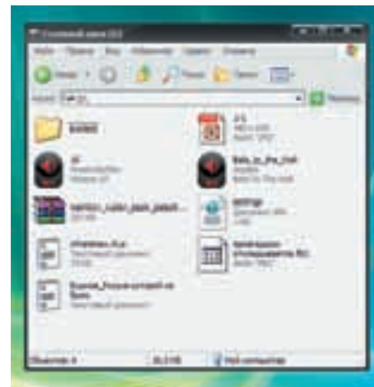
Содержимое памяти устройства

тера и дать положительный ответ на запрос о синхронизации, который появится на экране ORSiO b721.