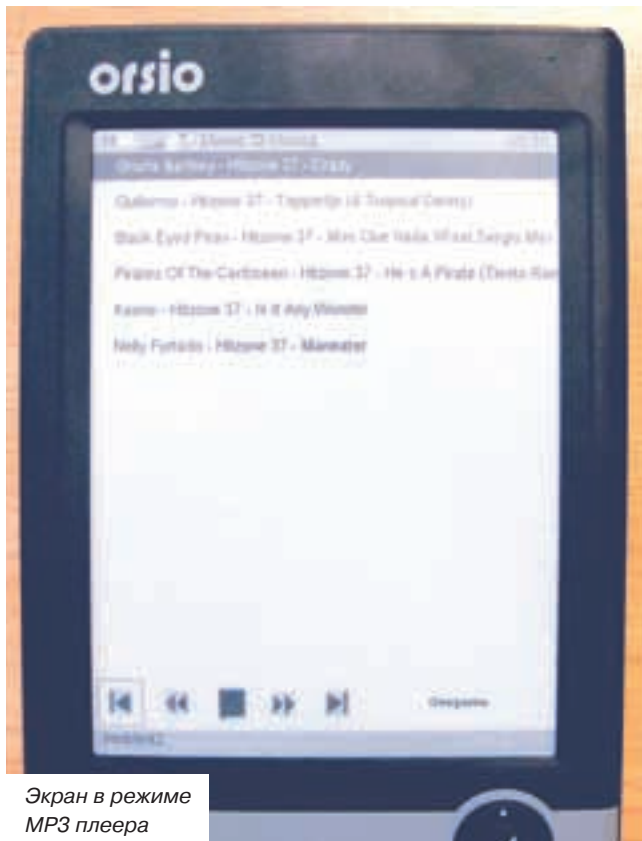
Экран в режиме MP3 плеера

электронные книги можно не только читать, но и слушать!