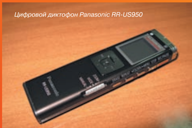
Цифровой диктофон Panasonic RR-US950