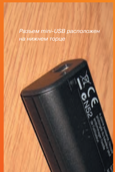
Разъем mini-USB расположен на нижнем торце