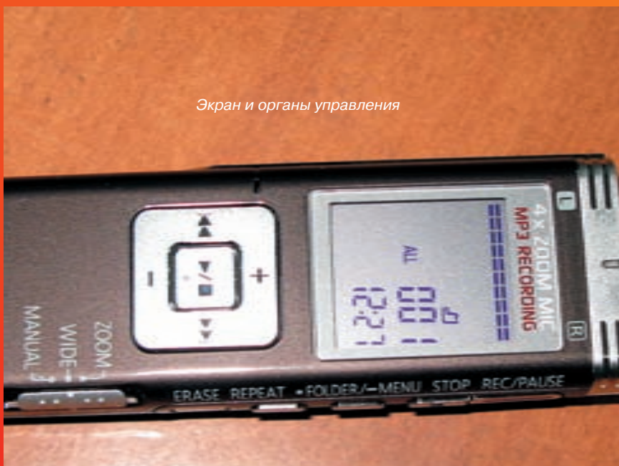
Экран и органы управления

В верхнем торце устройства расположились стерео-микрофоны и разъем для наушников, а снизу только разъем mini-USB. На тыльной стороне обнаруживается выпуклый кругляшок динамика, ползунок блокировки кнопок и крышечка отсека аккумулятора. Приподнятость динамика способствует тому, что его звук