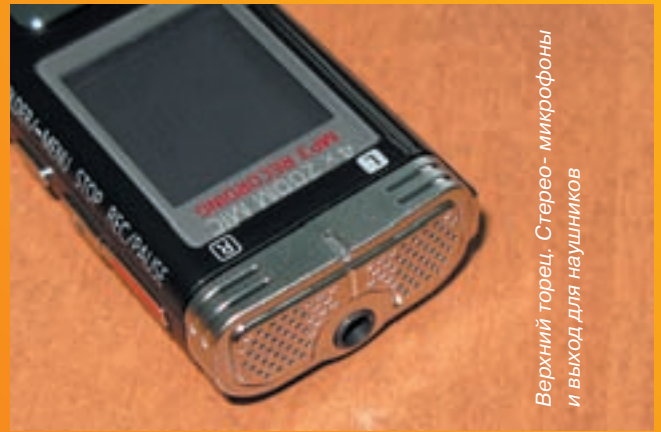
Верхний торец. Стерео- микрофоны и выход для наушников

сутствуют. Также производитель не счел нужным дополнить комплектность чехлом для защиты от случайных царапин и переходником для подключения к телефонной линии. Отсутствие последнего, правда, не слишком огорчает, так как почти все мобильные телефоны и большинство современных проводных телефонных аппаратов имеют режим громкой связи, который позволяет без проблем записывать ваш разговор с собеседником.