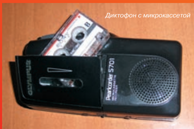
Диктофон с микрокассетой

К недостаткам аналоговых моделей относятся не самые малые размеры, потери качества при перезаписи, возможность «зажевывания» или размагничива-