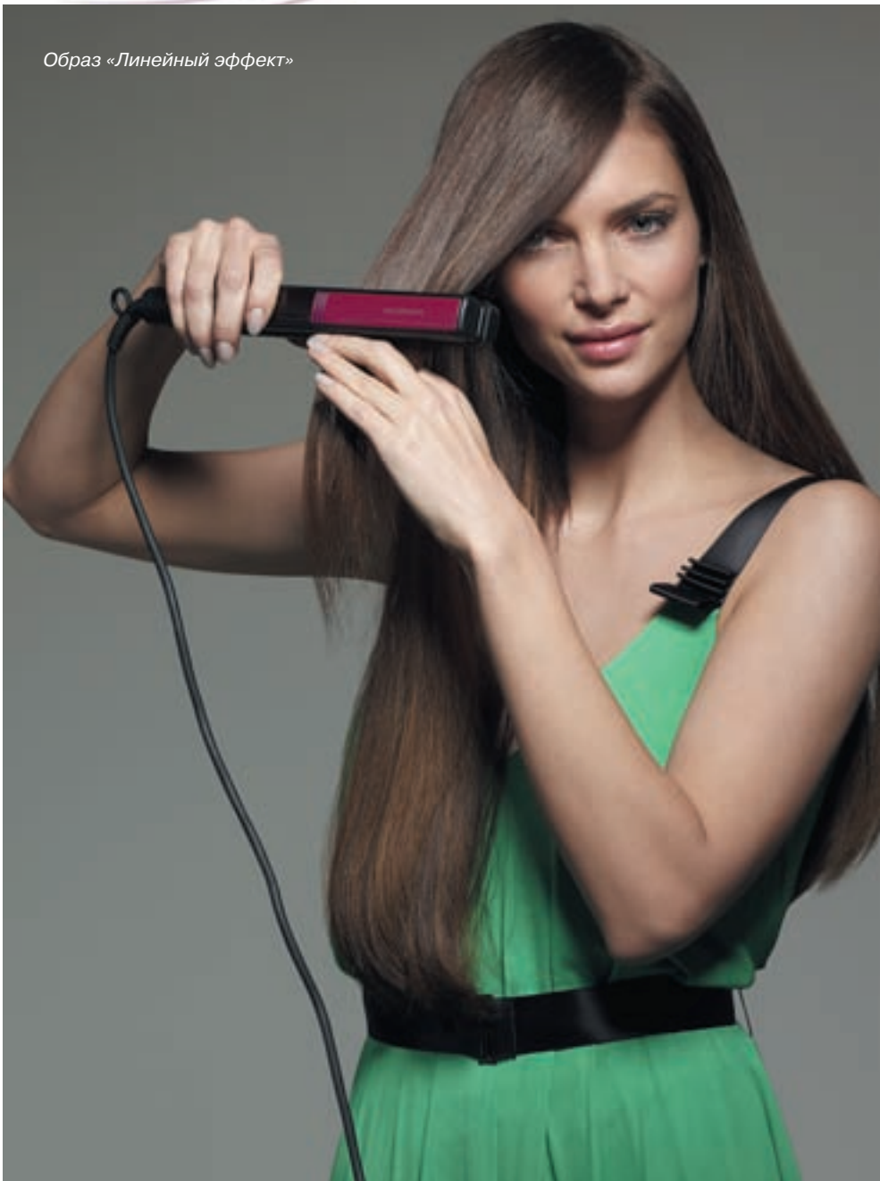
Образ «Линейный эффект»