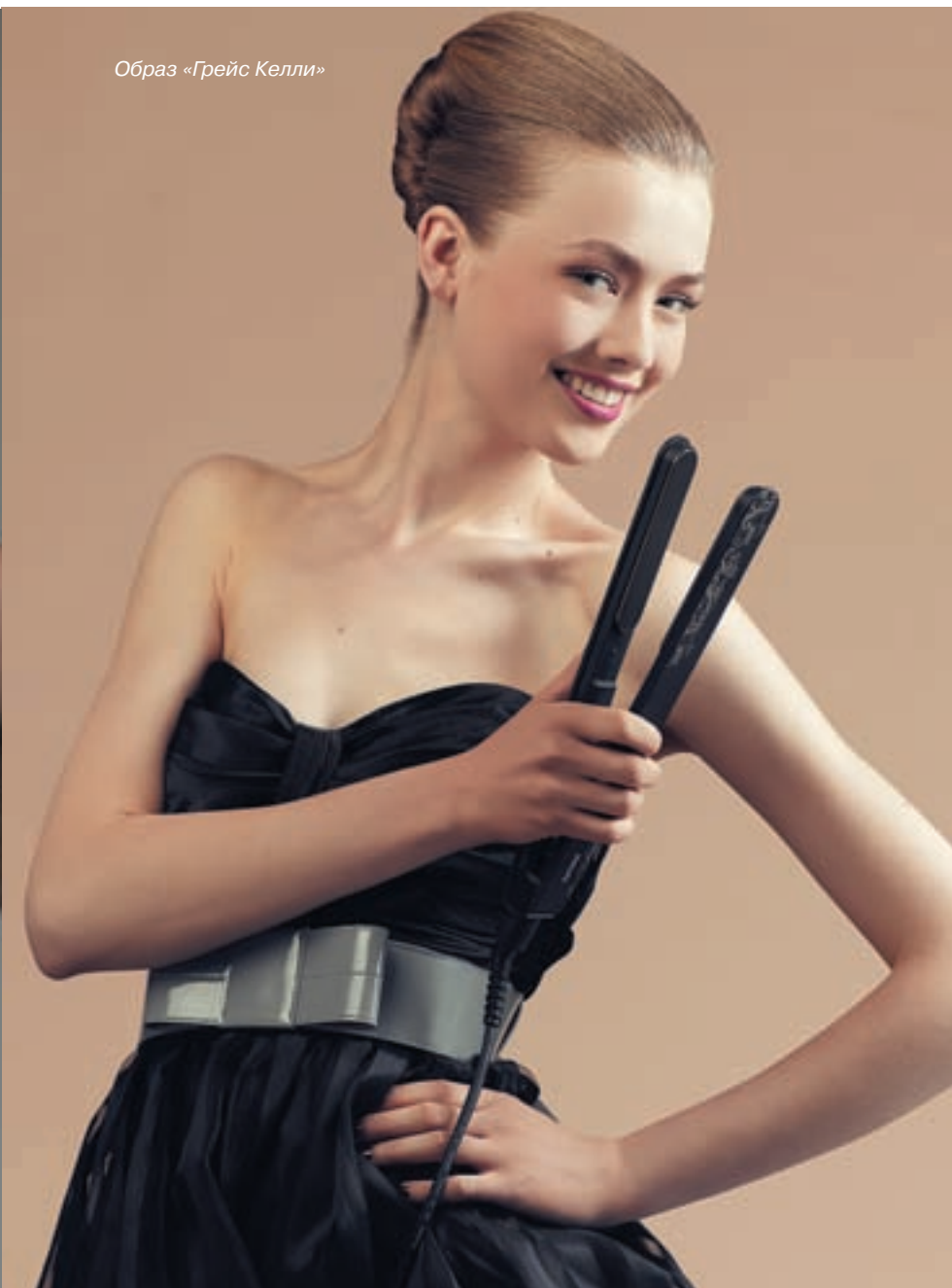
Образ «Грейс Келли»