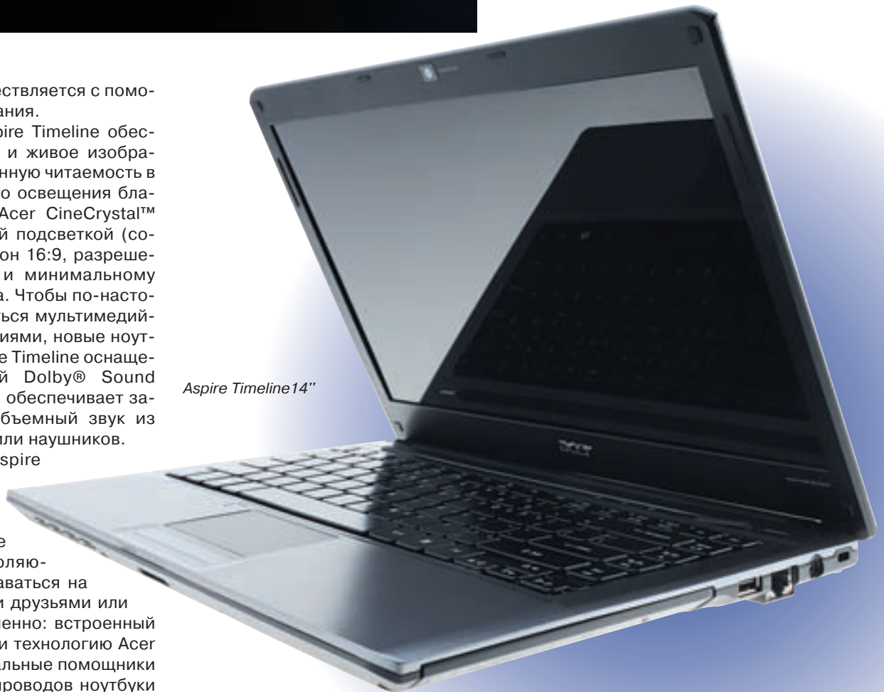
Aspire Timeline 14"

Линейка Aspire Timeline предлагает современные коммуникационные функции, позволяющие всегда оставаться на связи со своими друзьями или коллегами, а именно: встроенный Wi-Fi@/WiMAX™ и технологию Acer SignalUp™. Идеальные помощники для жизни без проводов ноутбуки