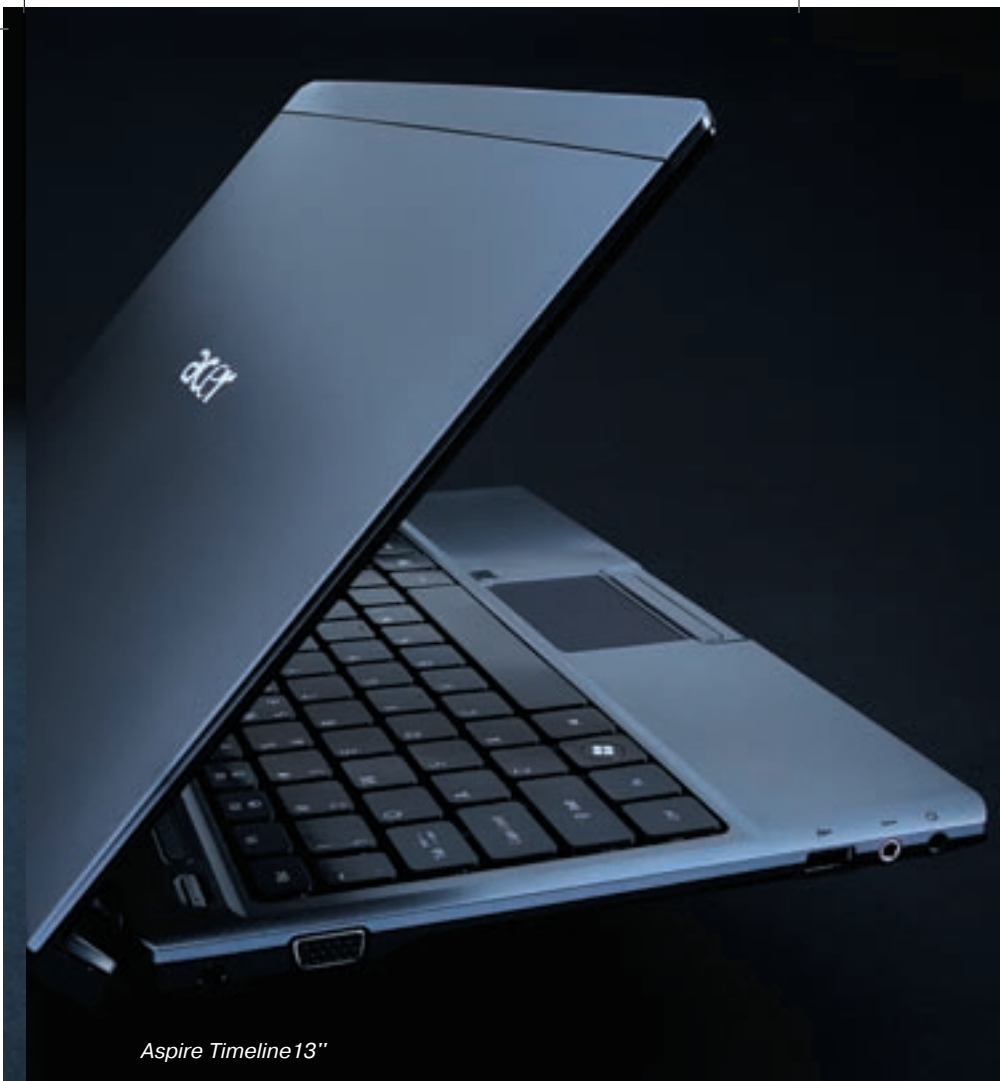
Aspire Timeline 13"

Aspire Timelines могут быть оснащены встроенным модулем 3G (опционально). С веб-камерой Acer Crystal Eye, оптимизированной для условий плохой освещенности и поддерживающей усовершенствованную технологию Acer PrimaLite™, пользователь может с легкостью проводить видео-конференции с бизнес-партнерами или общаться в режиме видео-чата с друзьями.